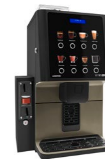
Kit module validateur Préparé pour installer un validateur de pièces.