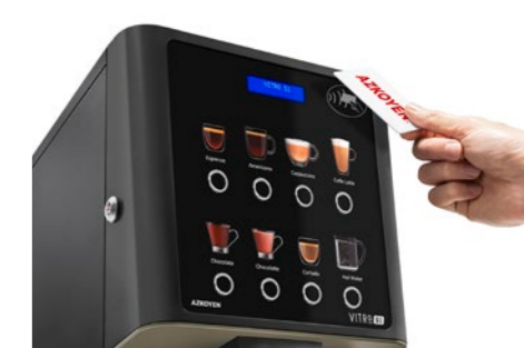
Kit Lecteur RFID Pour carte de recharge produit ou systèmes cashless.