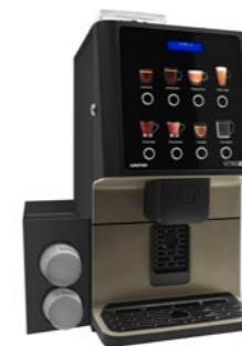
Kit module à gobelets Pour dispenser des gobelets.